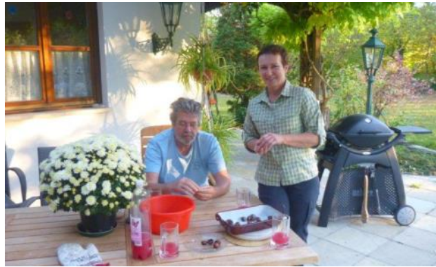
Sturm und Maroni "Hausgemacht".